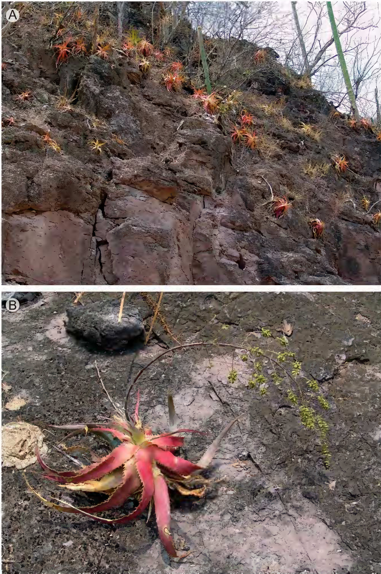
Fig. 1. Hechtia rubicunda López-Ferr. & Espejo. A. habitat; B. planta femenina.